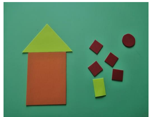
Игра 3 «Мой дом, моя семья»